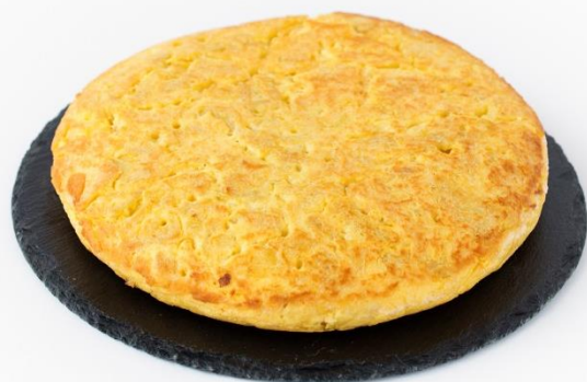
Tortilla de patata