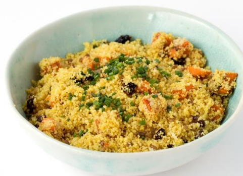
Cous Cous con verduras y curry