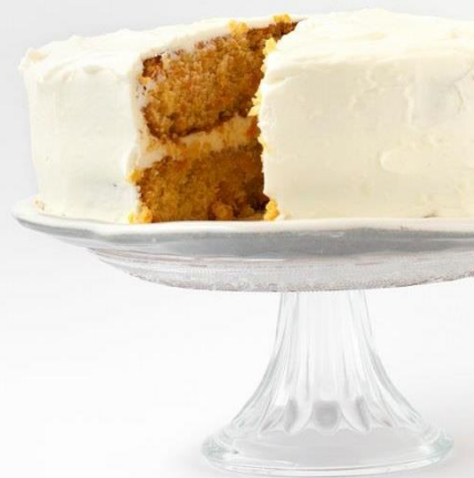
Tarda de zanahoria