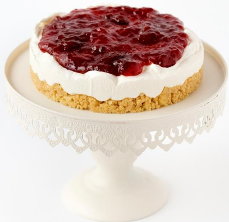
Tarta de queso y fresa