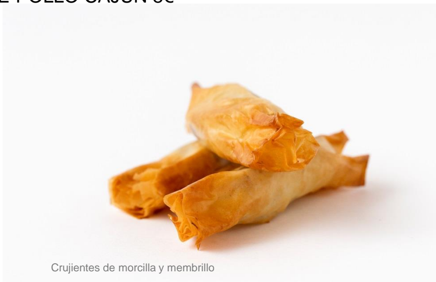
Crujientes de morcilla y membrillo

BOX SURTIDA (¡elige el sabor de los crujientes y quiches que más te guste!)