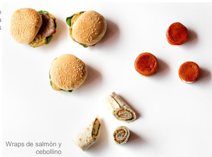
Blinis de tomate con crema de orégano