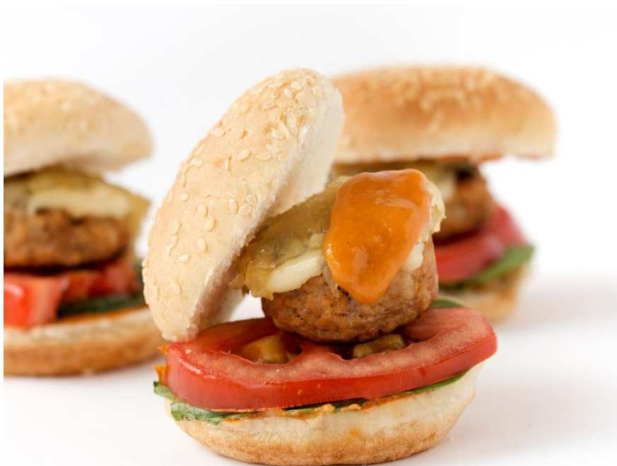
Mini-Burguer especial con salsa Menuteca