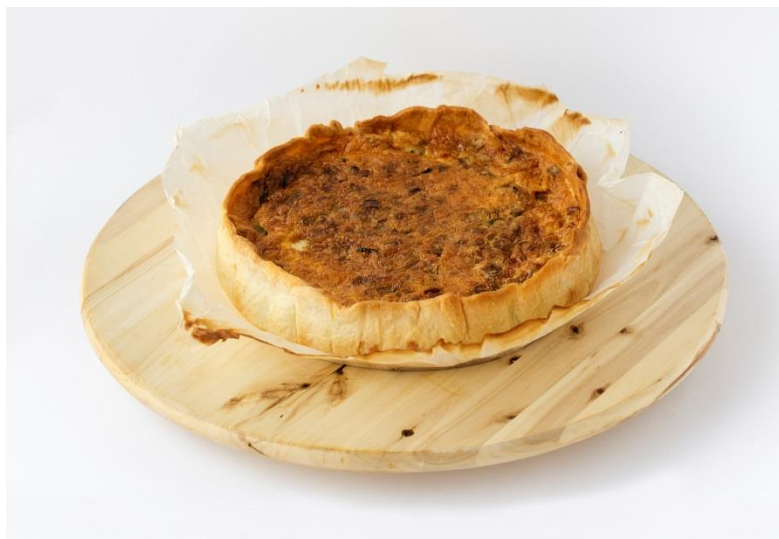
Quiche de verduras y queso de cabra